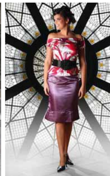
ÉKSZER: AMULETT ÉKSZER, PÉCS, IRGALMASOK UTCÁJA 3.