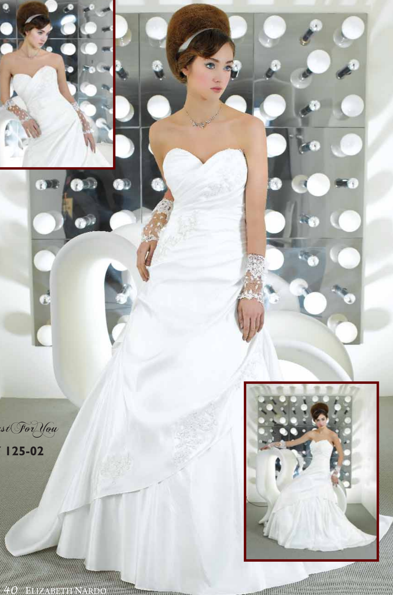
Just For You JFY 125-02