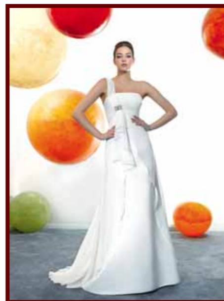
Just For You JFY 125-16