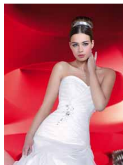
Just For You JFY 125-15